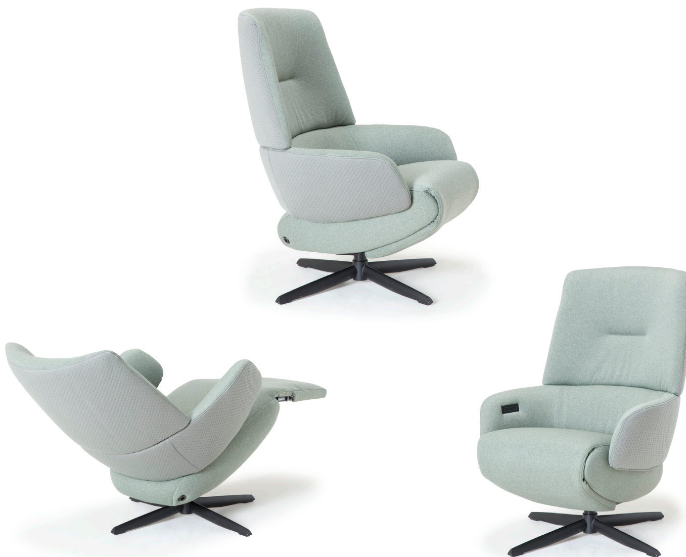
Afgebeeld: RV1024 met voet 72

Bij sommige modellen kan de rug worden uitgebreid met een opblaasbare lendensteun. Deze lendensteun is bij de handmatig verstelbare fauteuil alleen leverbaar met blaasbalg. Bij de elektrisch bedienbare fauteuil kan worden gekozen uit een handmatig - of elektrisch opblaasbare lendensteun en voor verwarming in de rug, zitting en voetklep.