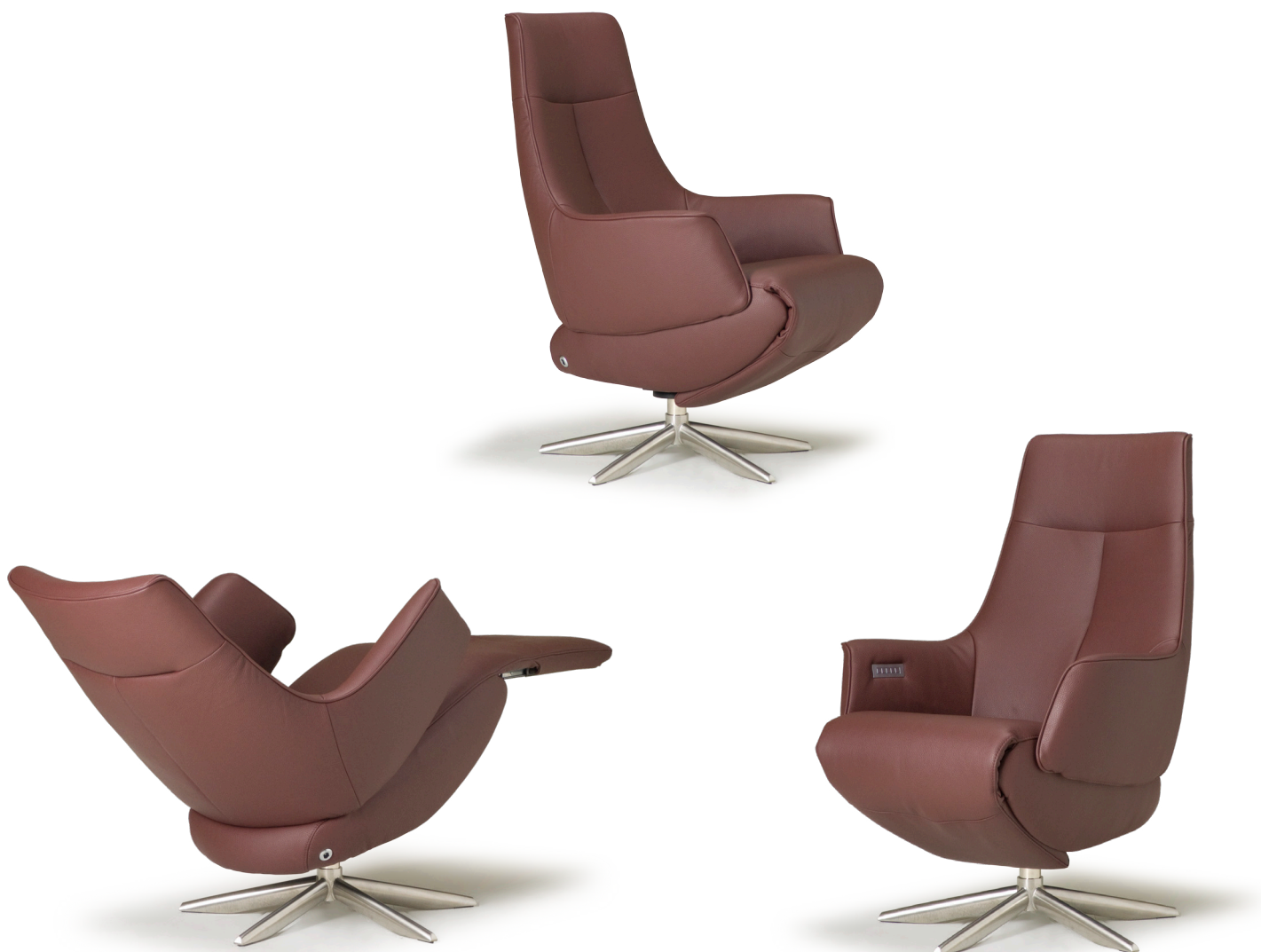
Afgebeeld: RV1010 met voet 41

De ruggen van alle Relax4u fauteuils zijn standaard voorzien van een handmatig verstelbare hoofdsteun. Als optie kan bij de fauteuil met motoren de hoofdsteun elektrisch verstelbaar bediend worden. Bij sommige modellen kan de rug worden uitgebreid met een opblaasbare lendensteun. Deze lendensteun is bij de handmatig verstelbare fauteuil alleen leverbaar met blaasbalg. Bij de elektrisch bedienbare fauteuil kan worden gekozen uit een handmatig - of elektrisch opblaasbare lendensteun en voor verwarming in de rug, zitting en voetklep.