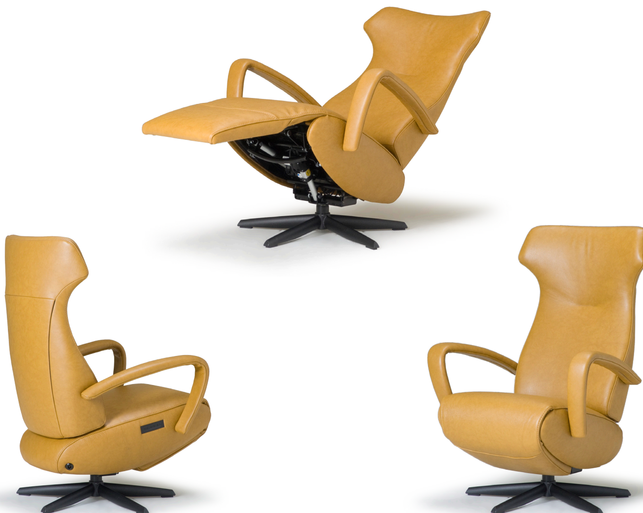
Afgebeeld: RV1007 met voet 42

De ruggen van alle Relax4u fauteuils zijn standaard voorzien van een handmatig verstelbare hoofdsteun. Als optie kan bij de fauteuil met motoren de hoofdsteun elektrisch verstelbaar bediend worden. Bij sommige modellen kan de rug worden uitgebreid met een opblaasbare lendensteun. Deze lendensteun is bij de handmatig verstelbare fauteuil alleen leverbaar met blaasbalg. Bij de elektrisch bedienbare fauteuil kan worden gekozen uit een handmatig - of elektrisch opblaasbare lendensteun en voor verwarming in de rug, zitting en voetklep.