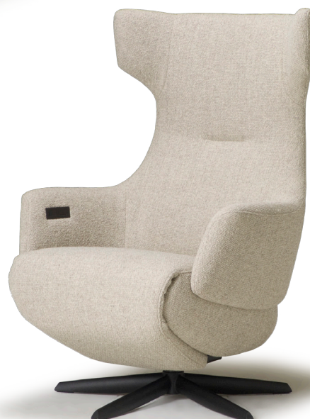
Afgebeeld: RV1005 met voet 42