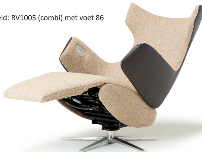
Afgebeeld: RV1005 (combi) met voet 86

De ruggen van alle Relax4u fauteuils zijn standaard voorzien van een handmatig verstelbare hoofdsteun. Als optie kan bij de fauteuil met motoren de hoofdsteun elektrisch verstelbaar bediend worden. Bij sommige modellen kan de rug worden uitgebreid met een opblaasbare lendensteun. Deze lendensteun is bij de handmatig verstelbare fauteuil alleen leverbaar met blaasbalg. Bij de elektrisch bedienbare fauteuil kan worden gekozen uit een handmatig - of elektrisch opblaasbare lendensteun en voor verwarming in de rug, zitting en voetklep.