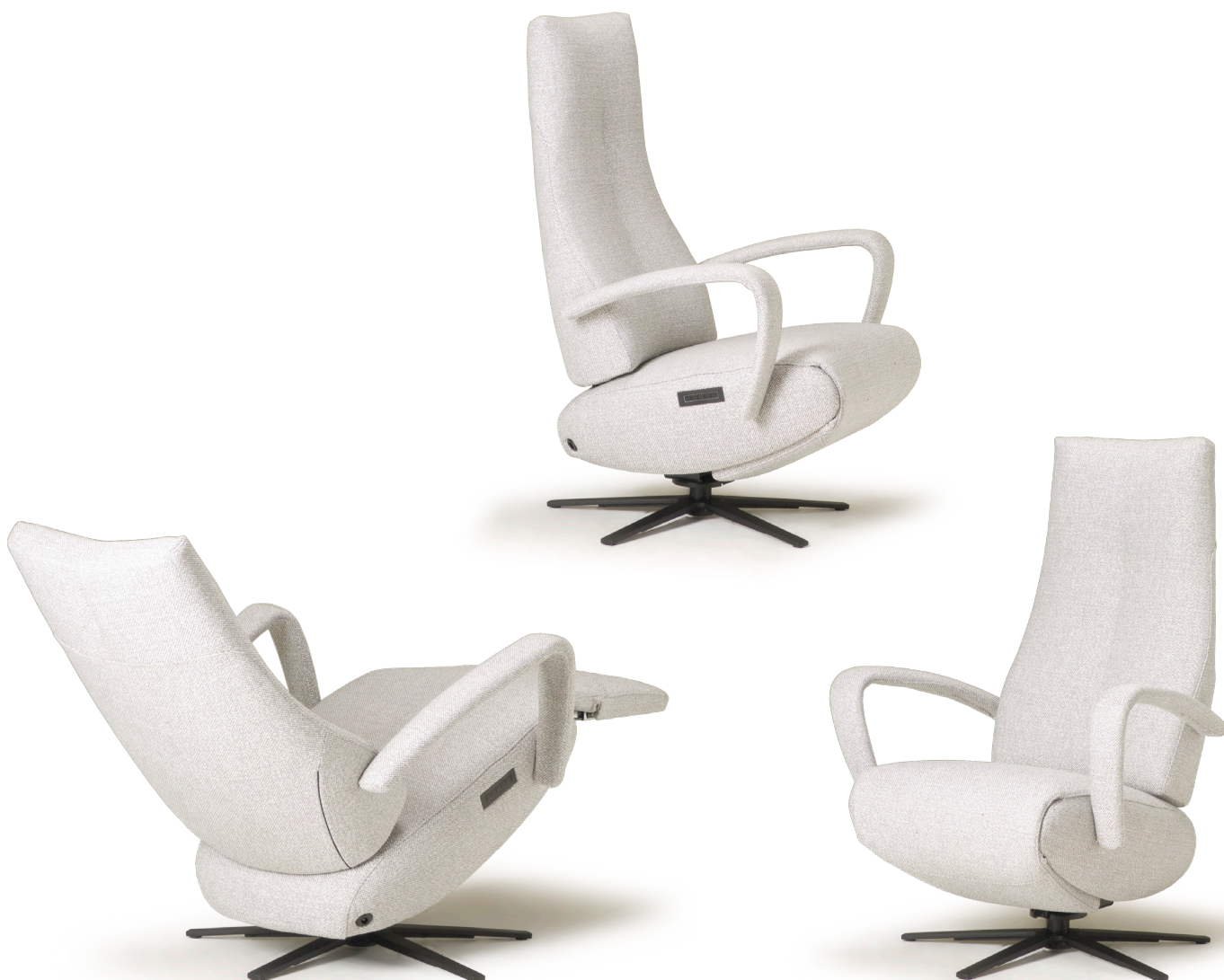
Afgebeeld: RV1004 met voet 87

De ruggen van alle Relax4u fauteuils zijn standaard voorzien van een handmatig verstelbare hoofdsteun. Als optie kan bij de fauteuil met motoren de hoofdsteun elektrisch verstelbaar bediend worden. Bij sommige modellen kan de rug worden uitgebreid met een opblaasbare lendensteun. Deze lendensteun is bij de handmatig verstelbare fauteuil alleen leverbaar met blaasbalg. Bij de elektrisch bedienbare fauteuil kan worden gekozen uit een handmatig - of elektrisch opblaasbare lendensteun en voor verwarming in de rug, zitting en voetklep.