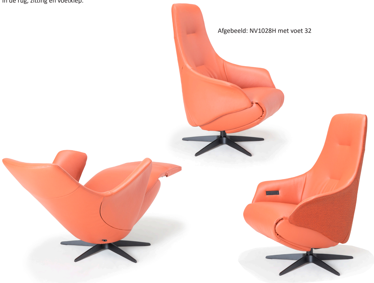
Afgebeeld: NV1028H met voet 32

De ruggen van alle Relax4u fauteuils zijn standaard voorzien van een handmatig verstelbare hoofdsteun. Als optie kan bij de fauteuil met motoren de hoofdsteun elektrisch verstelbaar bediend worden. Bij sommige modellen kan de rug worden uitgebreid met een opblaasbare lendensteun. Deze lendensteun is bij de handmatig verstelbare fauteuil alleen leverbaar met blaasbalg. Bij de elektrisch bedienbare fauteuil kan worden gekozen uit een handmatig - of elektrisch opblaasbare lendensteun en voor verwarming in de rug, zitting en voetklep.