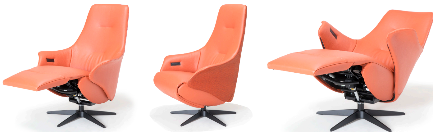
**metrages bij combi-stoffering

* Bij een fauteuil met zwarte voet wordt een zwarte tiptoetsbediening en oplaadplug ingebouwd. Bij voet 25 of voet 45 dient u de kleur van het tiptoetspaneel aan te geven.