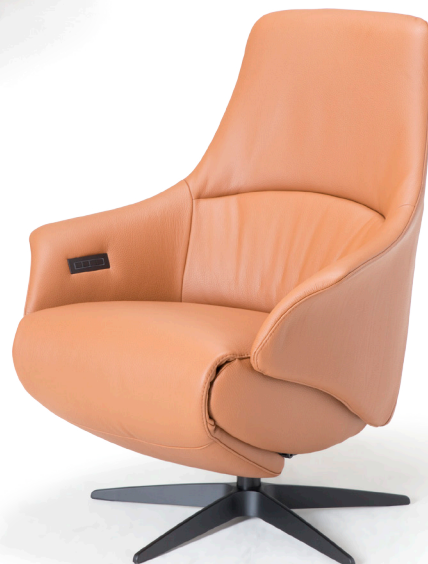
Afgebeeld: NV1027L met voet 32