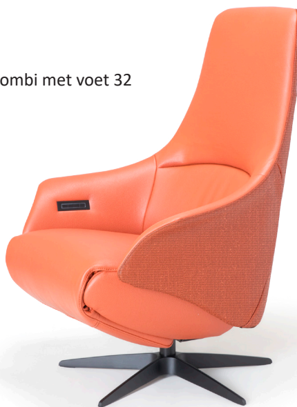
Afgebeeld: NV1027H combi met voet 32

De ruggen van alle Relax4u fauteuils zijn standaard voorzien van een handmatig verstelbare hoofdsteun. Als optie kan bij de fauteuil met motoren de hoofdsteun elektrisch verstelbaar bediend worden. Bij sommige modellen kan de rug worden uitgebreid met een opblaasbare lendensteun. Deze lendensteun is bij de handmatig verstelbare fauteuil alleen leverbaar met blaasbalg. Bij de elektrisch bedienbare fauteuil kan worden gekozen uit een handmatig - of elektrisch opblaasbare lendensteun en voor verwarming in de rug, zitting en voetklep.