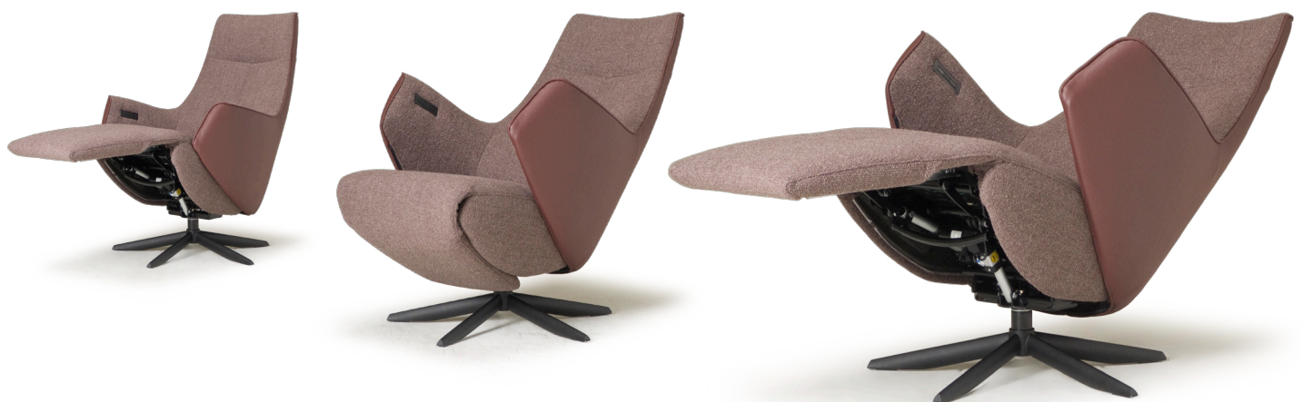
**metrages bij combi-stoffering

* Bij een fauteuil met zwarte voet wordt een zwarte tiptoetsbediening en oplaadplug ingebouwd. Bij voet 25 of voet 45 dient u de kleur van het tiptoetspaneel aan te geven.