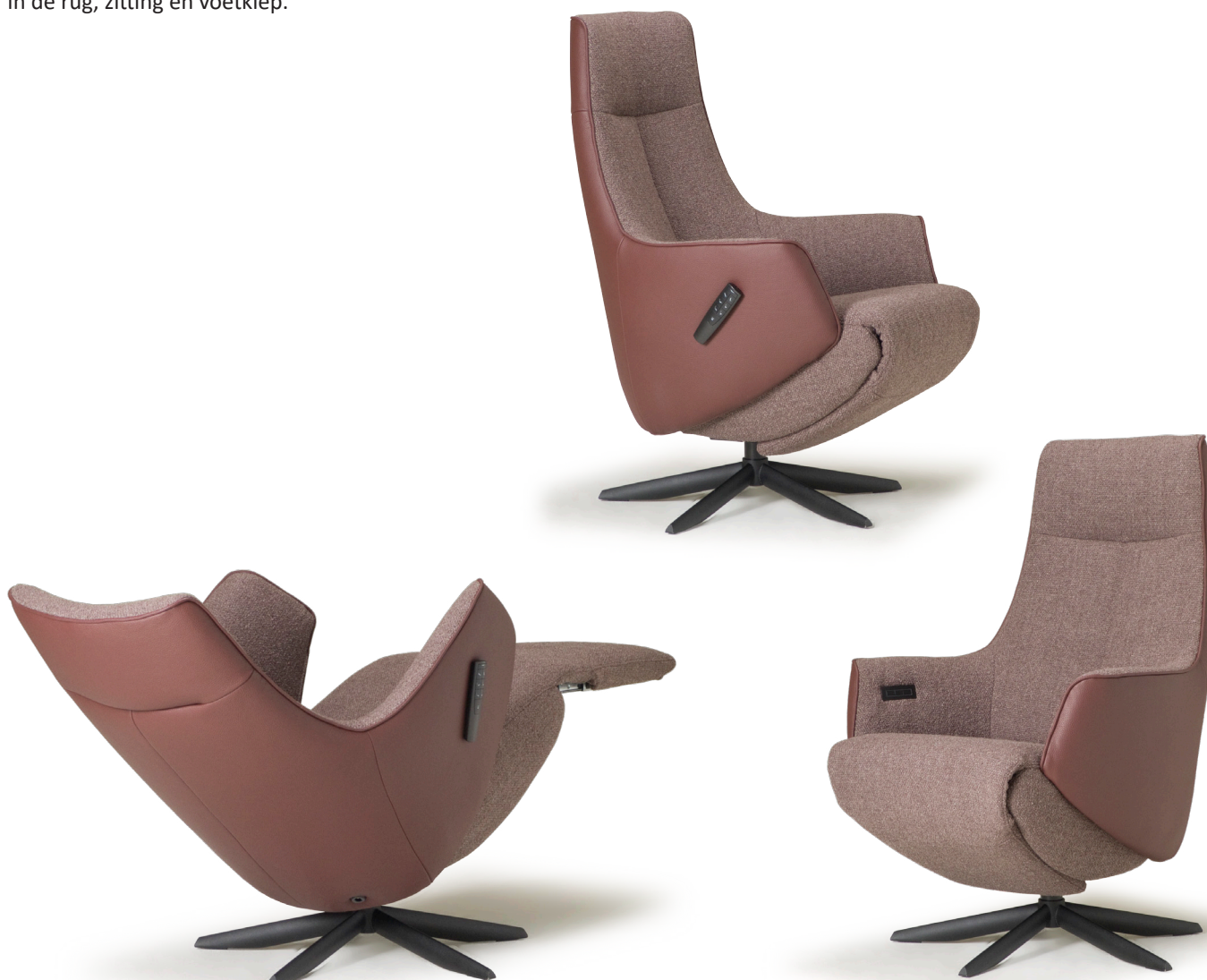
Afgebeeld: NV1010 met voet 42

De ruggen van alle Relax4u fauteuils zijn standaard voorzien van een handmatig verstelbare hoofdsteun. Als optie kan bij de fauteuil met motoren de hoofdsteun elektrisch verstelbaar bediend worden. Bij sommige modellen kan de rug worden uitgebreid met een opblaasbare lendensteun. Deze lendensteun is bij de handmatig verstelbare fauteuil alleen leverbaar met blaasbalg. Bij de elektrisch bedienbare fauteuil kan worden gekozen uit een handmatig - of elektrisch opblaasbare lendensteun en voor verwarming in de rug, zitting en voetklep.