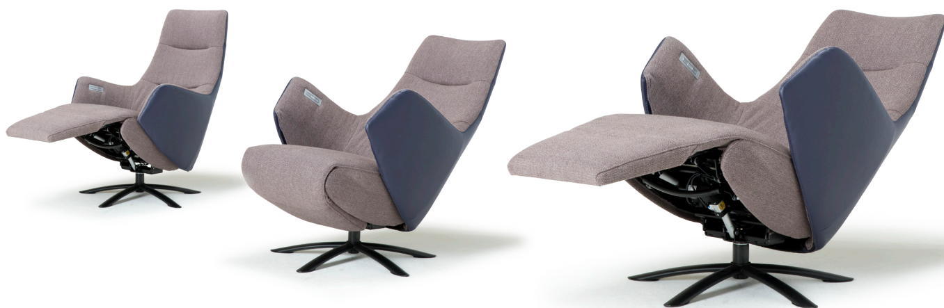
**metrages bij combi-stoffering

* Bij een fauteuil met zwarte voet wordt een zwarte tiptoetsbediening en oplaadplug ingebouwd. Bij voet 25 of voet 45 dient u de kleur van het tiptoetspaneel aan te geven.