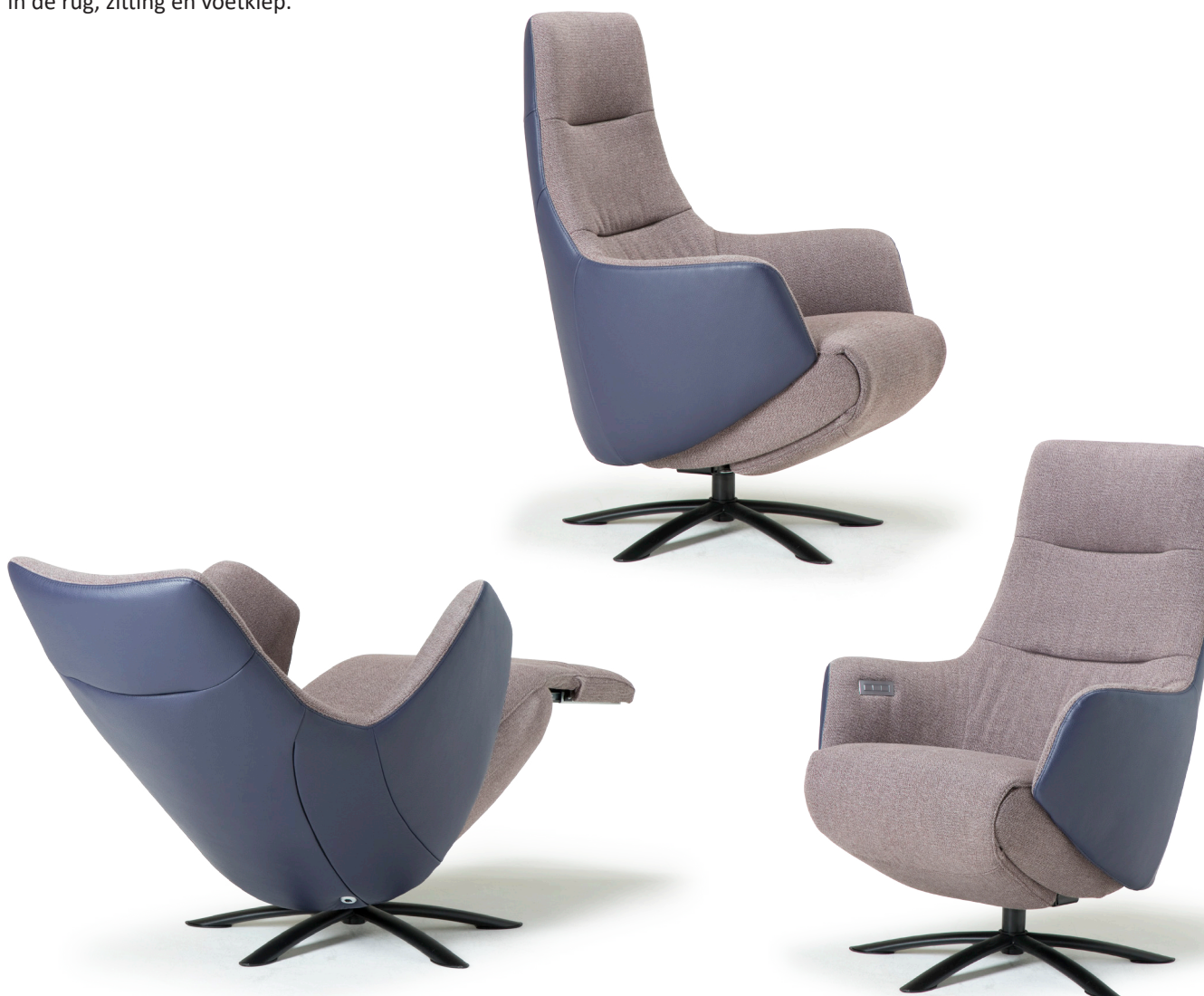
Afgebeeld: NV1009 met voet 88

De ruggen van alle Relax4u fauteuils zijn standaard voorzien van een handmatig verstelbare hoofdsteun. Als optie kan bij de fauteuil met motoren de hoofdsteun elektrisch verstelbaar bediend worden. Bij sommige modellen kan de rug worden uitgebreid met een opblaasbare lendensteun. Deze lendensteun is bij de handmatig verstelbare fauteuil alleen leverbaar met blaasbalg. Bij de elektrisch bedienbare fauteuil kan worden gekozen uit een handmatig - of elektrisch opblaasbare lendensteun en voor verwarming in de rug, zitting en voetklep.