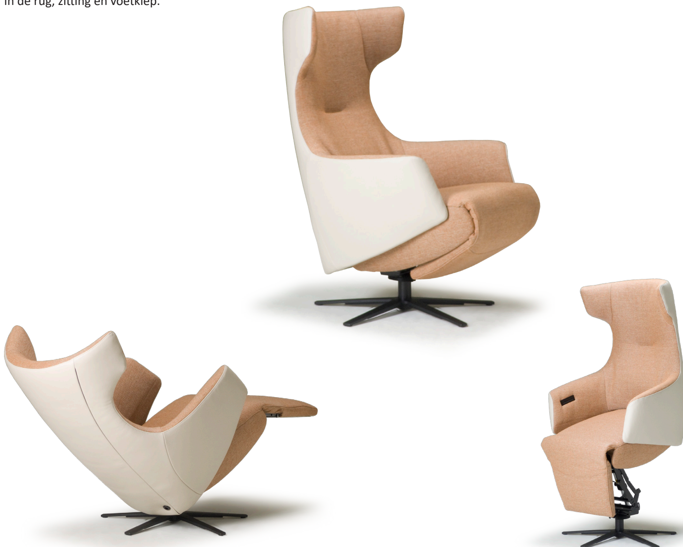
Afgebeeld: NV1005 met voet 87 (combi-stoffering)

De ruggen van alle Relax4u fauteuils zijn standaard voorzien van een handmatig verstelbare hoofdsteun. Als optie kan bij de fauteuil met motoren de hoofdsteun elektrisch verstelbaar bediend worden. Bij sommige modellen kan de rug worden uitgebreid met een opblaasbare lendensteun. Deze lendensteun is bij de handmatig verstelbare fauteuil alleen leverbaar met blaasbalg. Bij de elektrisch bedienbare fauteuil kan worden gekozen uit een handmatig - of elektrisch opblaasbare lendensteun en voor verwarming in de rug, zitting en voetklep.